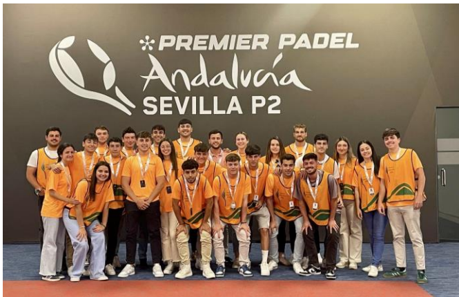
Premier Padel Sevilla P2