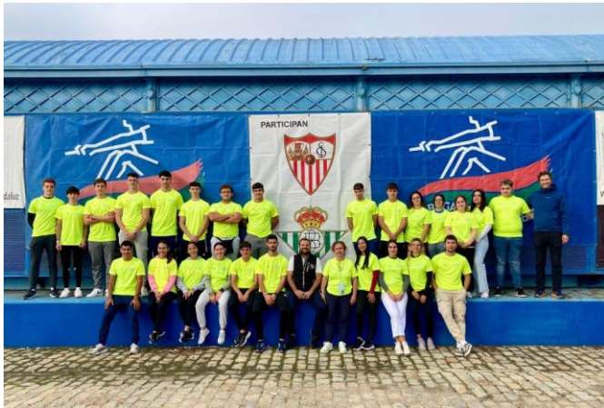
Regata Sevilla- Betis