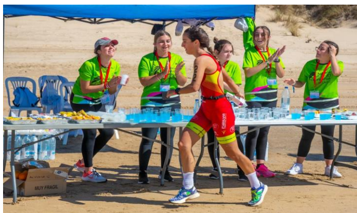
Andalucía Desafío Doñana