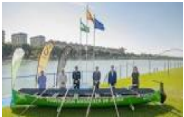
Sevilla International Rowing Master Regatta