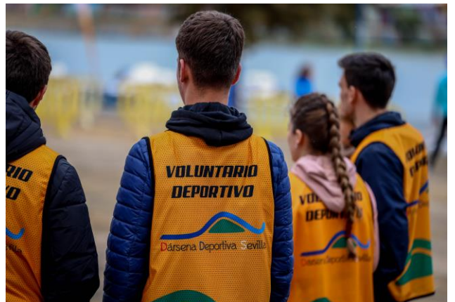
Cto. de España de Piragüismo