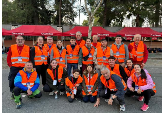
Medio Maratón Sevilla